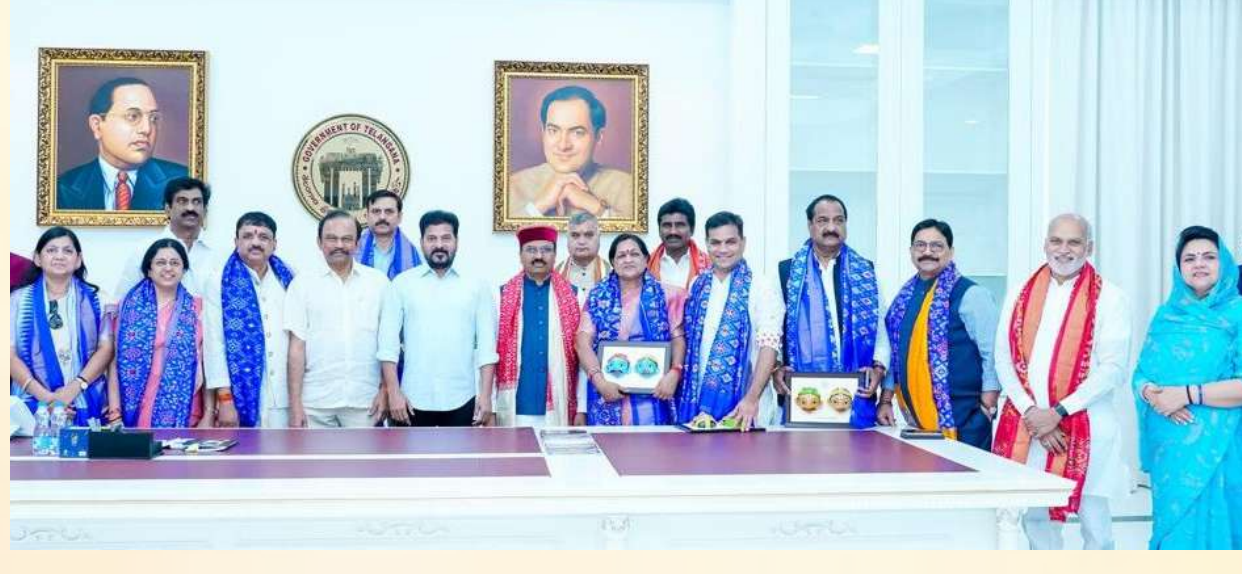
హైదరాబాద్, (ప్రజాక్షేత్రం): తెలంగాణ రాష్ట్ర రాజధాని హైదరాబాద్ నగరాన్ని ప్రపంచ స్థాయి ప్రమాణాలతో తీర్చిదిద్దడమే లక్ష్యంగా ప్రభుత్వం అడుగులు వేస్తోంది. పార్లమెంటరీ స్టాండింగ్ కమిటీ సమావేశంలో పాల్గొన్న ముఖ్యమంత్రి రేవంత్ రెడ్డి, రాష్ట్ర అభివృద్ధికి సంబంధించిన కీలక విజన్ ను ఆవిష్కరించారు. ఆధునికీకరణ మరియు పట్టణీకరణ వల్ల భవిష్యత్తులో ఎదురయ్యే సవాళ్లను ఎదుర్కోవడానికి ఇప్పటి నుంచే ప్రణాళికాబద్ధంగా ముందుకు సాగాలని ఆయన పిలుపునిచ్చారు. పెరుగుతున్న పట్టణ జనాభాకు అనుగుణంగా మౌలిక సదుపాయాలను మెరుగుపరచడం అత్యవసరమని, ఈ క్రమంలోనే 'తెలంగాణ రైజింగ్ 2047' పేరుతో ఒక భూకౌశల ..మిగతా 2లో

'తెలంగాణ రైజింగ్-2047' మాస్టర్ ప్లాన్ పారామెంటరీ స్టాండింగ్ కమిటీలో సీఎం రేవంత్ వివరణ నగరాన్ని సిగ్గులే రహితంగా మార్చేందుకు ప్రణాళికలు అండర్ పాస్, సర్వేస్, ఎలివేటెడ్ పద్ధతులతో మార్పులు రాష్ట్రాన్ని క్యూర్, ప్యూర్, రేర్ అనే మూడు రకాలుగా వర్గీకరణ. సర్వేస్, మాన్యుఫ్యాక్చరింగ్, అగ్రికల్చర్ సెక్టార్లకు గుర్తింపు కేవలం రోడ్ల విస్తరణ కాకుండా బహుళ రవాణా వ్యవస్థల బలోపేతం కాలుష్య నియంత్రణలో భాగంగా ఈవీ బస్సులు ఉచిత రెట్టో ఫిట్టింగ్ ఆటోల పంపిణీ రాష్ట్ర సంస్కృతిలో మూసీ లివర్ ఫుట్ అభివృద్ధి అనుసంధానం పట్టణీకరణకు అనుగుణంగా మౌలిక వసతుల కల్పనకు ప్రాధాన్యం