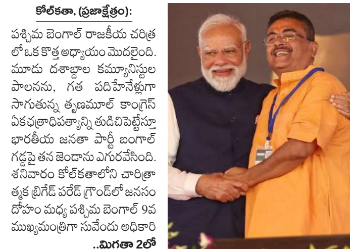
కోల్ కతా, (ప్రజాక్షేత్రం): పశ్చిమ బెంగాల్ రాజకీయ చరిత్రలో ఒక కొత్త అధ్యాయం మొదలైంది. మూడు దశాబ్దాల కమ్యూనిస్టుల పాలనను, గత పదిహేనేళ్లగా సాగుతున్న తృణమూల కాంగ్రెస్ ఏకచక్రాధిపత్యాన్ని తుడిచిపెట్టేస్తూ భారతీయ జనతా పార్టీ బంగారీ గడ్డపై తన జెండాను ఎగురవేసింది. శనివారం కోల్ కతాలోని చారిత్రాత్మక బ్రిగేడ్ పరేడ్ గ్రౌండ్ లో జననం దోహదం మధ్య పశ్చిమ బెంగాల్ 9వ ముఖ్యమంత్రిగా సువేందు అధికారి ..మిగతా 2లో

9వ ముఖ్యమంత్రిగా సువేందు అధికారి ప్రమాణ స్వీకారం కోల్ కతాలోని బ్రిగేడ్ గ్రౌండ్ లో అట్టహాసంగా కార్యక్రమం అసెంబ్లీ ఎన్నికల్లో 207 స్థానాలతో బీజేపీ ప్రభుత్వం పదిహేనేళ్ల టీఎంసీ పాలనకు చరమగీతం దిద్దిన ఓడించి సీఎం పీఠాన్ని అధిరోపించిన సువేందు. సువేందుతో పాటు మంత్రుల ప్రమాణ స్వీకారం హాజరైన ప్రధాని మోదీ, అమిత్ షా, ఏపీ సీఎం చంద్రబాబు రాష్ట్రంలో 'డబుల్ ఇంజిన్' సర్కార్ తో అభివృద్ధి నవ శకం ప్రారంభమైందన్న సీఎం సువేందు అధికారి